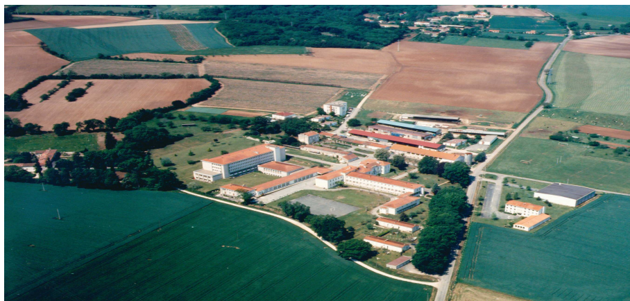
L'établissement en 1979