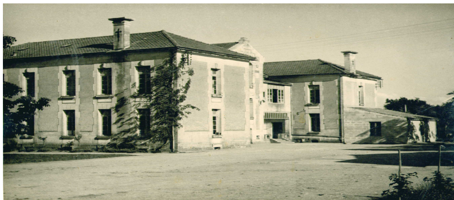
Virgile en 1950 avant les travaux

12 octobre 1908 : Examen d'admission de l'école professionnelle d'agriculture. Début des cours le 13 octobre 1908. 40 places disponibles, la première promo comptera 8 élèves (sur dix inscrits au concours d'entrée).